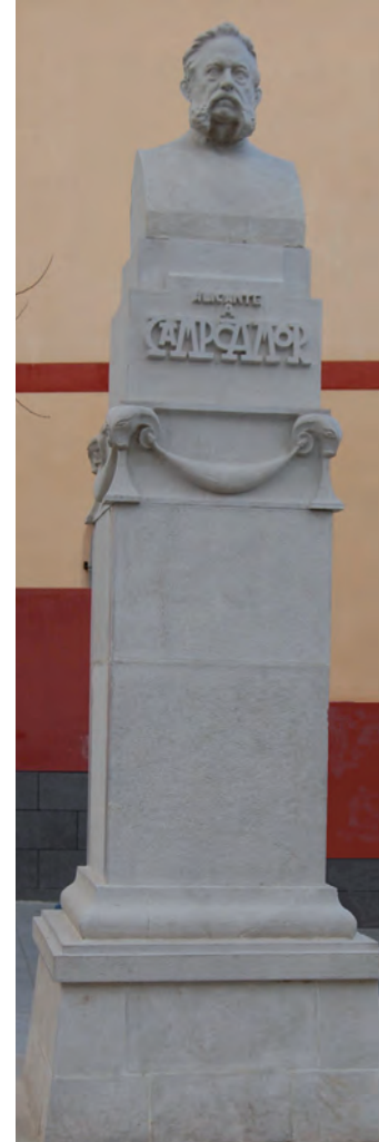
Monumento en Alicante a Ramón de Campoamor

Practicó también el asturiano el escepticismo más agudo y hasta se preocupó de lo que le gustaría fuera su propio retrato: “Leyó por entretenerse; escribió para divertirse, vivió haciendo al prójimo todo el bien que pudo, y se morirá con gusto por olvidar el mal que muchos prójimos le hicieron”. Escrito queda.